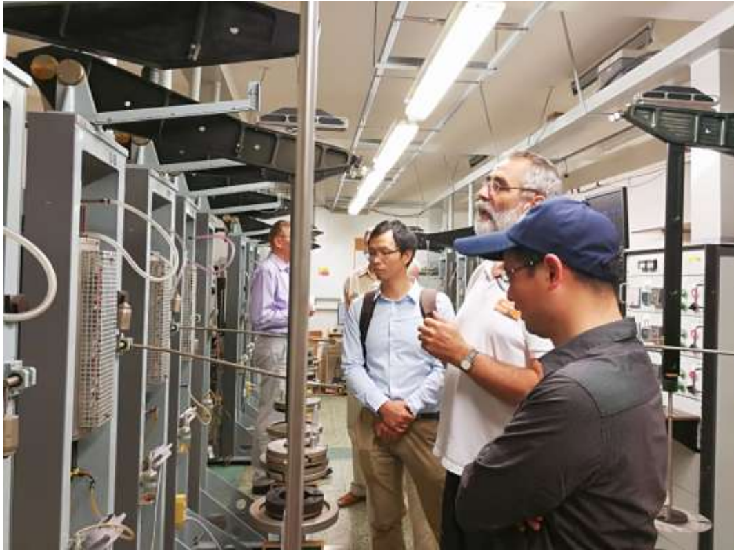
参观捷克科学院材料物理研究所科研设备