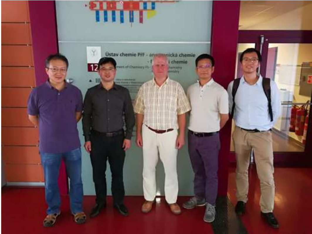
在捷克 Masaryk 大学交流