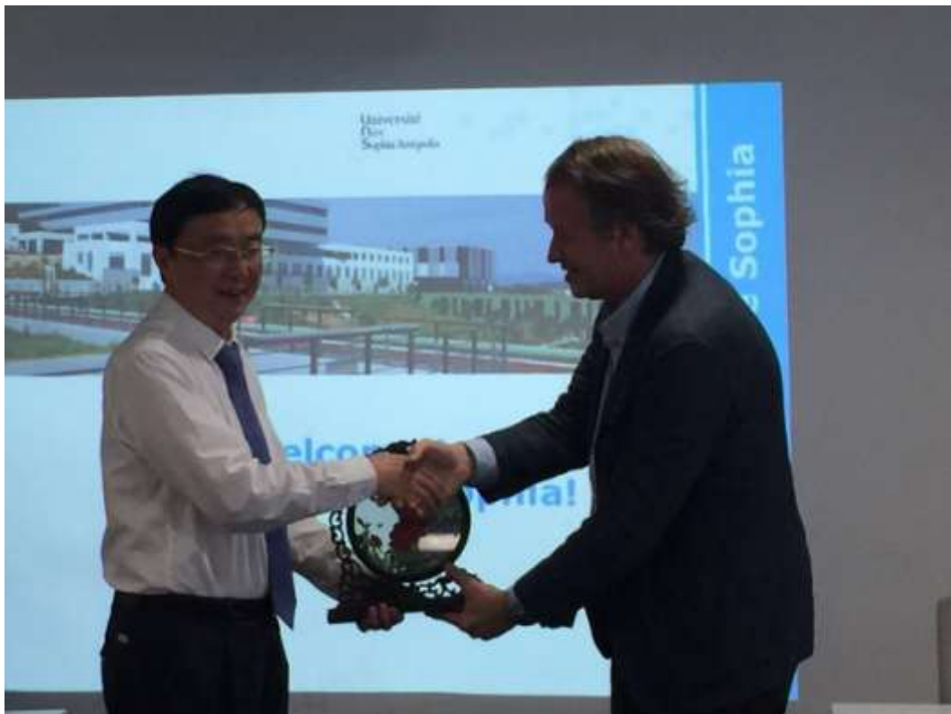
与尼斯索菲亚综合理工校长合影