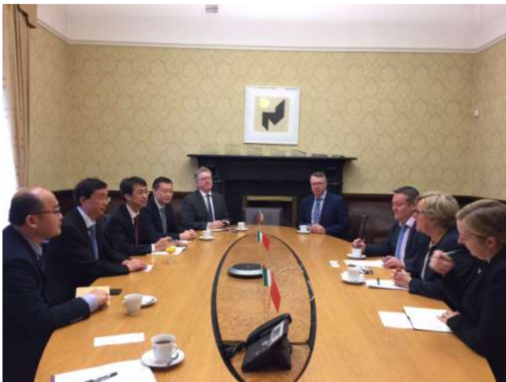
会见爱尔兰教育技能部副秘书长