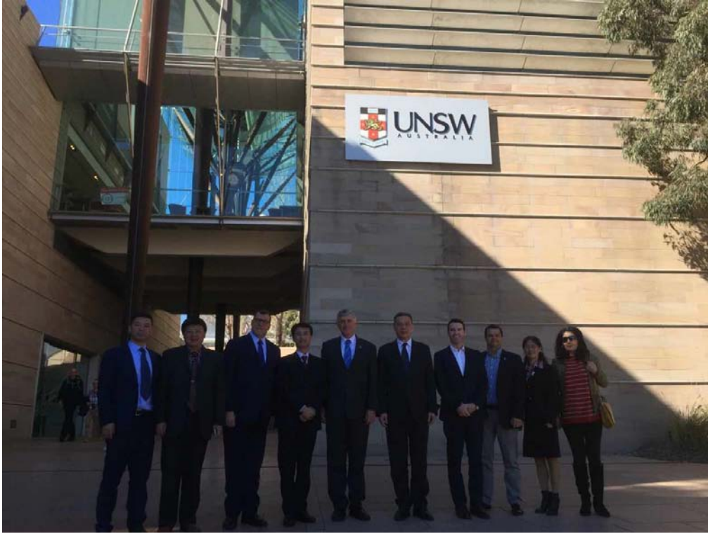
与新南威尔士大学采矿学院合影