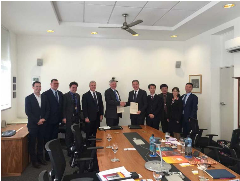
与新南威尔士大学会见