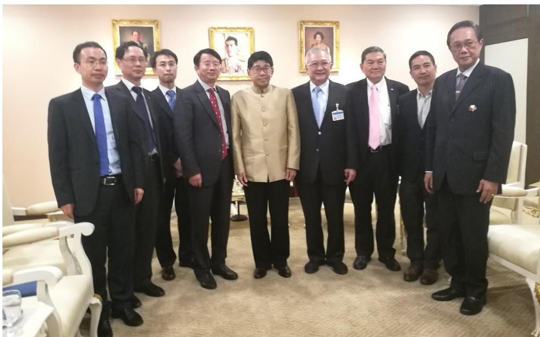
泰国副总理威萨努·科安接见中南大学代表团