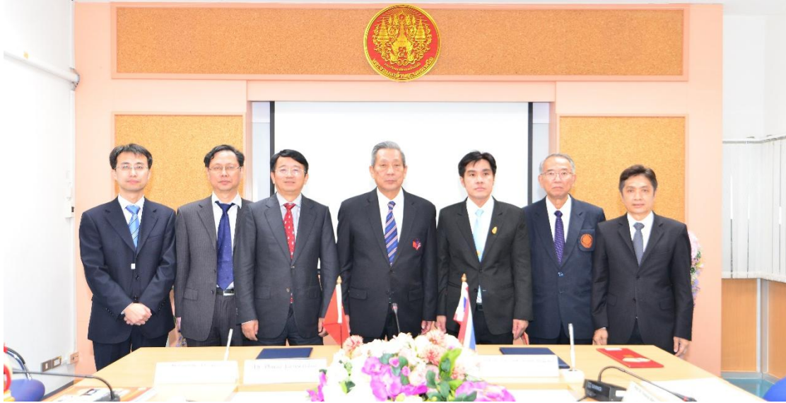
中南大学代表团与泰国北曼谷先皇科技大学会谈