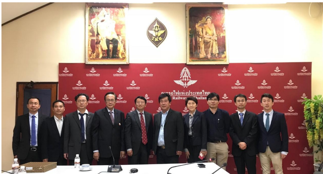
中南大学代表团与泰国国家铁路局会谈