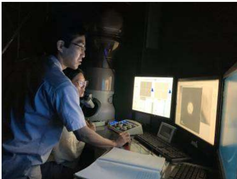
实验技术人员进行现场支持