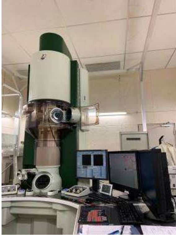
日本电子九州大学定制版 ARM200CF 电镜 B